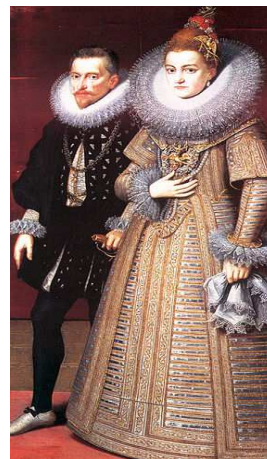
Albrecht and Isabella van Oostenrijk

"Nos saludamos Remunj la ciudad del rey y Obispo". We groeten Roermond de stad van Koning en Bisschopen en wij danken Philips II, Karel V en alle Habsburgse koningen die Roermond als hoofdstad van het overkwartier Gelre bezochten. Dit was de Spaanse afsluiting van een presentatie over de "Spaanse Tijd", bijna 160 jaar lang, met een korte