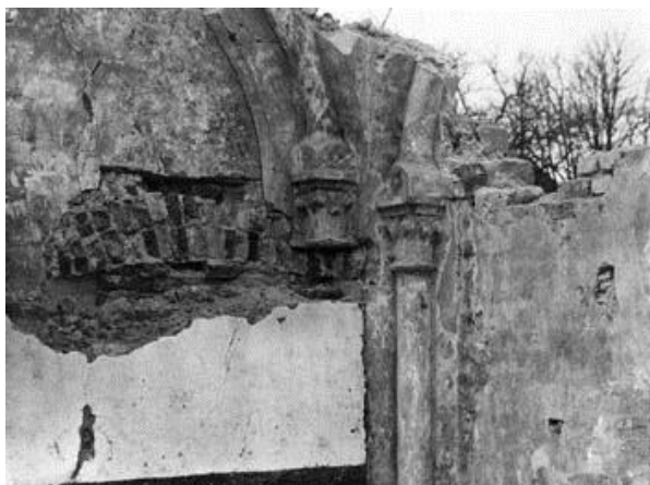
De sloop in 1924

In 1924 werden de laatste gebouwen van de voormalige Munsterabdij gesloopt.